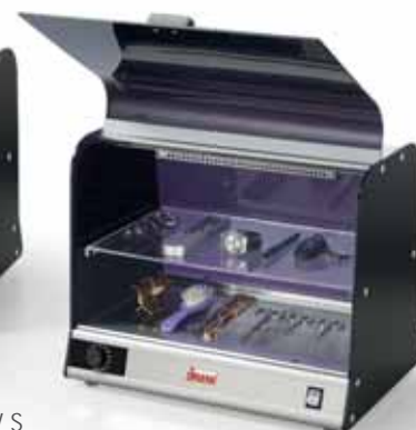
VISTA UVC 16W S