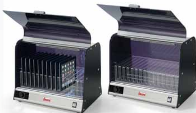
VISTA UVC 16W SH

Rastrelliera supporto tablet e smartphone opzionale Optional tablets and smartphone holder