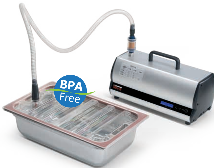
Contenitori GN 1/1 - 1/2 - 1/3 (h.100/150) con coperchio in Tritan opzionali Optional containers GN 1/1 - 1/2 - 1/3 (h.100/150) with cover in Tritan 0-80% vuoto / vacuum