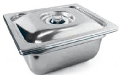
Contenitori GN 1/1 - 1/2 (h.100/150) con coperchio inox Containers GN 1/1 - 1/2 (h.100 / 150) with s/steel cover 0-100% vuoto / vacuum