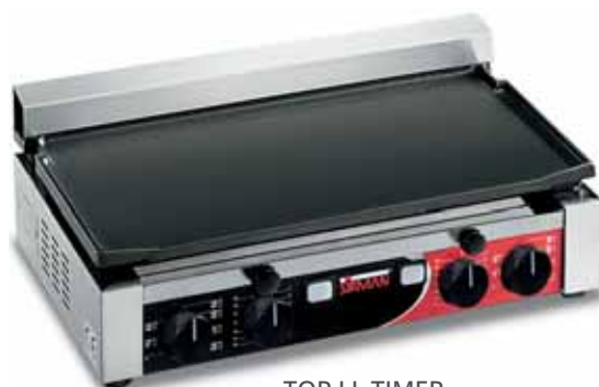
TOP LL TIMER