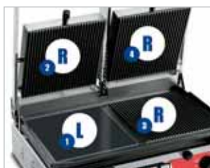
Legenda modelli Models key