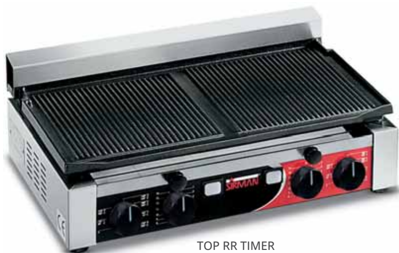
TOP RR TIMER