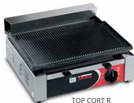
TOP CORT R