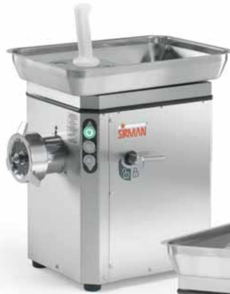
TC 22 NEBRASKA