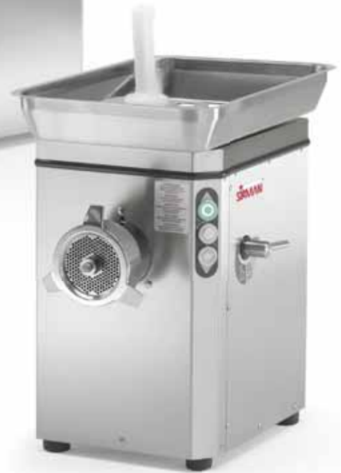
TC 32 NEBRASKA