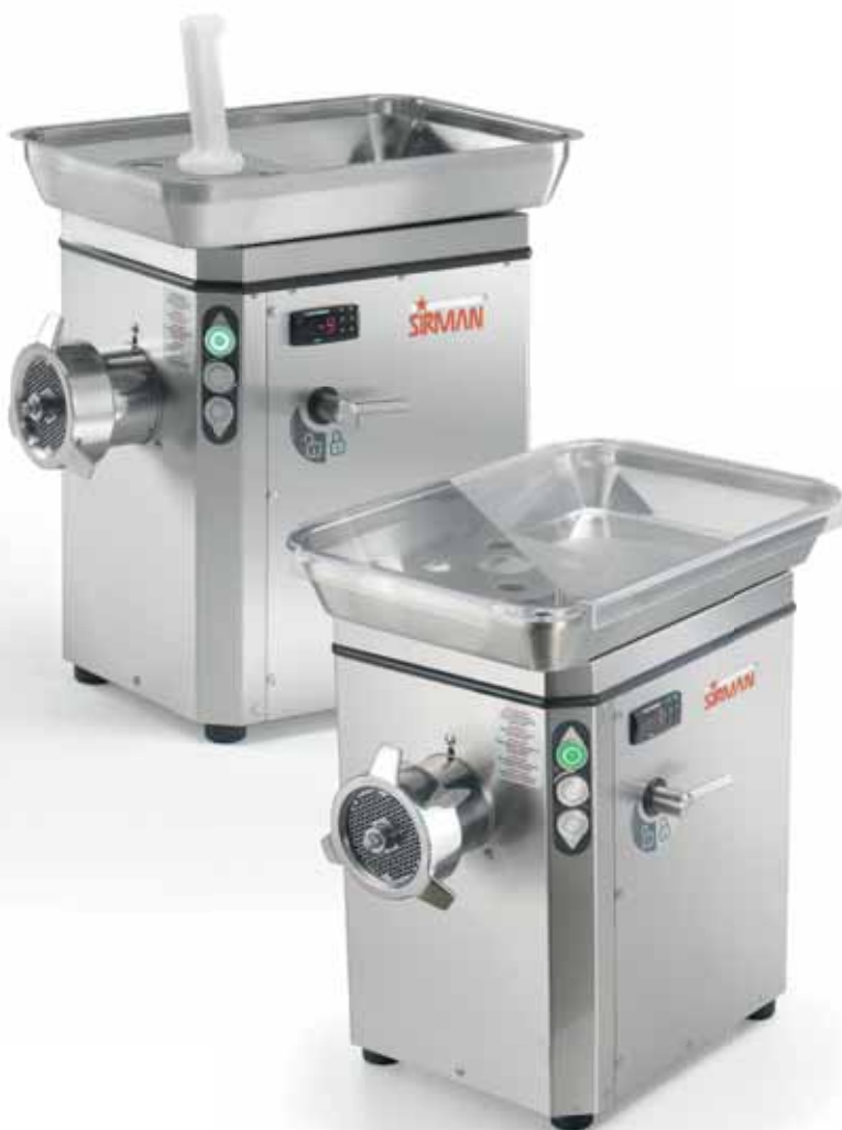
TC 32 NEBRASKA ICE

Coperchio tramoggia in plexiglass di serie Standard plexiglass feed tray lid