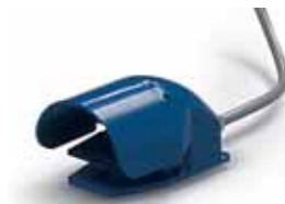
Pedaliera Pedal controls