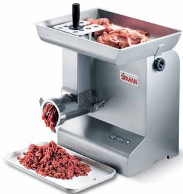
TC 32 BUFFALO