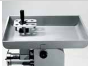
Tramoggia gigante Larger feed tray