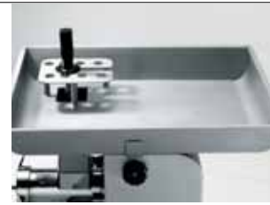
Tramoggia super Larger tray super