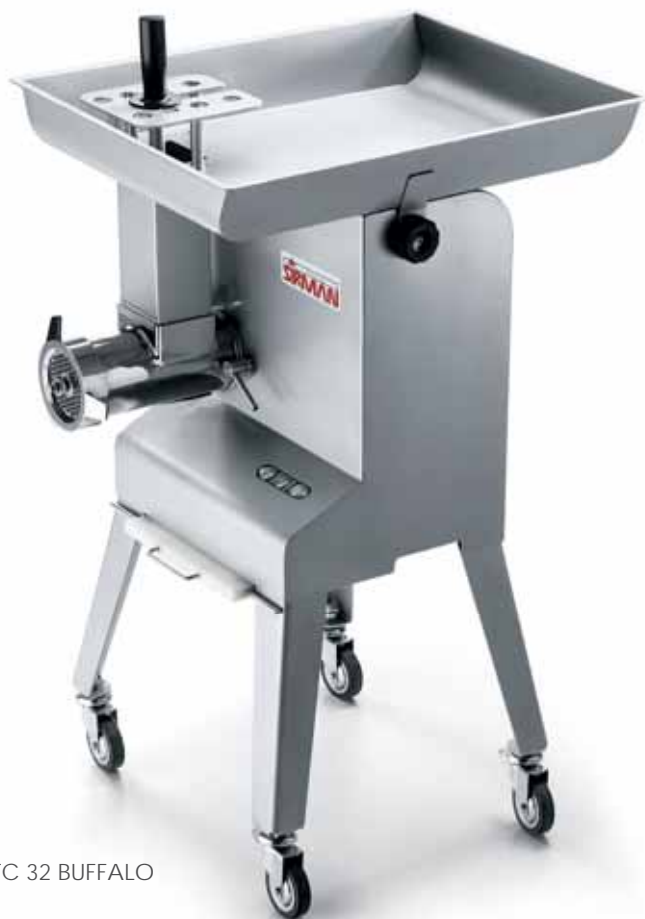
TC 32 BUFFALO