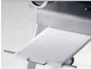
Supporto vassoio Tray support