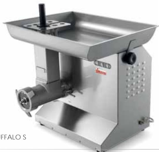
TC 32 BUFFALO S