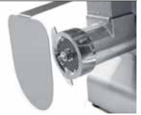
Paraspruzzi di serie Standard splash guard