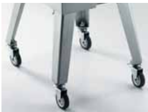
Gambe con ruote Legs with wheels