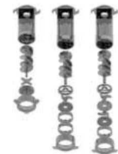
Standard o enterprise 1/2 Unger Unger Totale