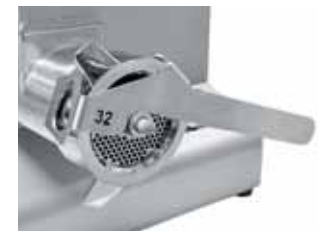
Leva avita/svita ghiera di serie Standard ring fixing/removing tool