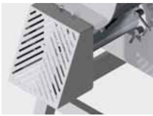
Protezione bocca per piastra con foro Ø > 8 mm Safety device for Ø > 8 mm plates