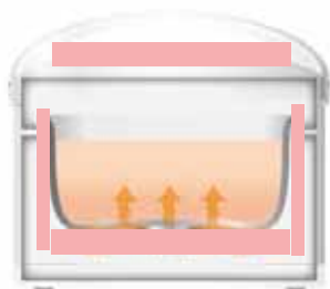
Calore dal fondo, dalle pareti e dall'alto Mechanical heater on the bottom, side and top