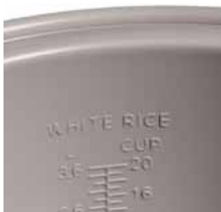
Interno vasca cuociriso graduata Measuring marks inside the rice cooker pot