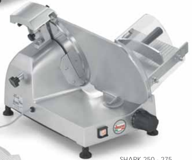
SHARK 250 - 275