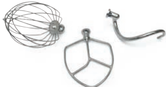
Accessori inox Plutone 7 Plus / EL Plus Plutone 7 Plus / EL Plus standard s/s accessory