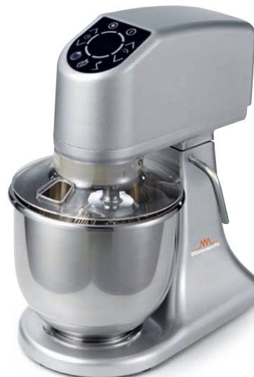
PLUTONE 7 EL