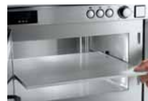
Secondo piano estraibile per i modelli NE 2143-2 e NE 2153-2