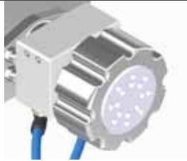
Frio: Kit per raffreddare la bocca Frio: head cooling kit