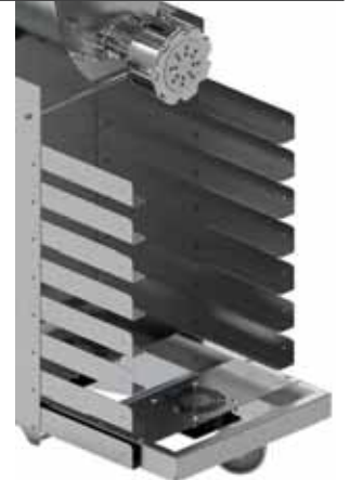
RACK: rastrelliera portacassette cm 60x40 h.7 DRYER: cassetto asciugapasta RACK: tray holder from cm 60x40 h.7 DRYER: pasta dryer