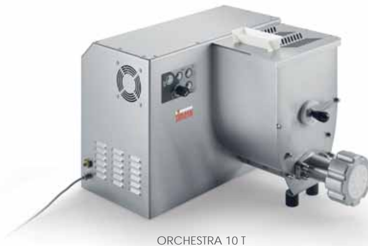
ORCHESTRA 10 T