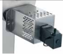
Tagliapasta Pasta cutter