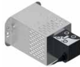
Tagliapasta automatico Automatic pasta cutter