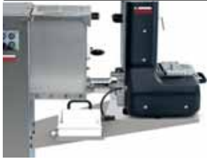
Supporto Raviomatic Raviomatic support