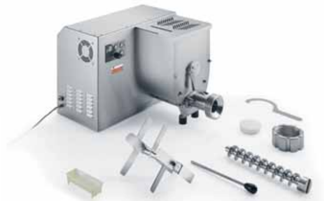
ORCHESTRA 10 T