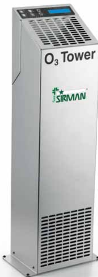
O 3 TOWER TOP