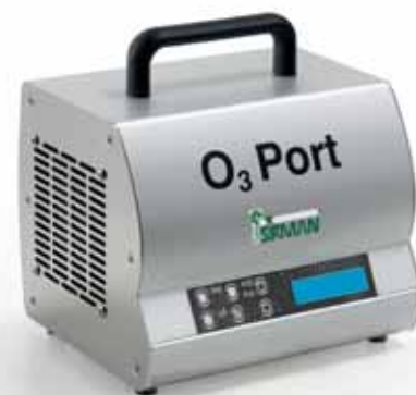
O 3 PORT TOP