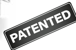
MASTER 90 Y 12