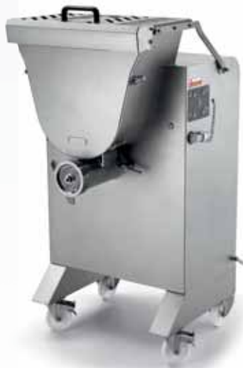
MASTER 30 Y12