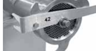
Leva awita/svita ghiera TC 42 standard Standard TC42 ring fixing/removing tool