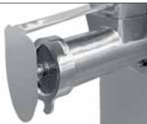
Paraspruzzi Splash guard