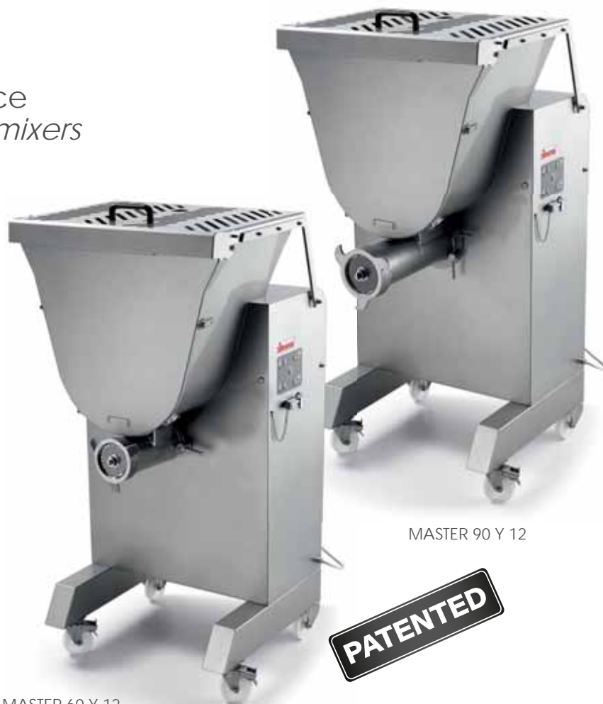
MASTER 60 Y 12