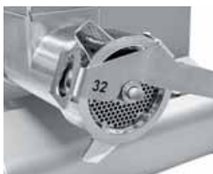
Leva awita/svita ghiera TC 32 standard Standard TC 32 ring fixing/removing tool