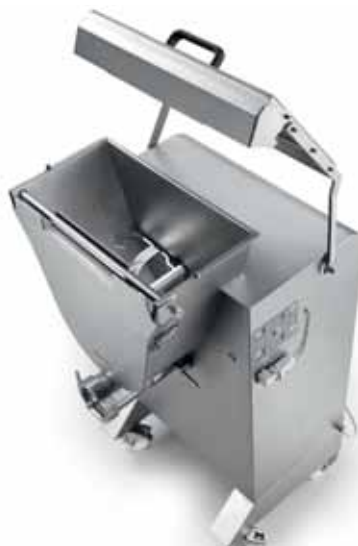
Coperchio con sollevamento automatico Lid with self lifting