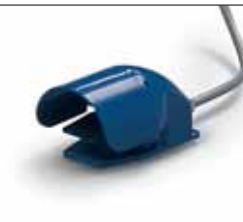
Pedaliera solo con Full Control Pedal controls only with Full Control