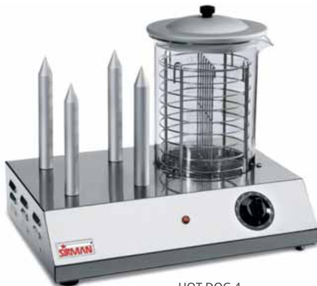
HOT DOG 4