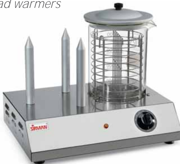
HOT DOG 3