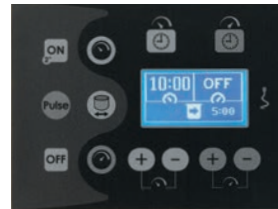
Display digitale Digital display