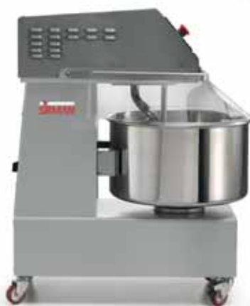
Ampio spazio per una facile pulizia Large space for easy cleaning