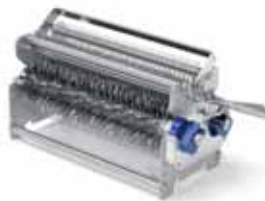
Lame inteneritrice con 96 lame Tenderizing knives with 96 blades