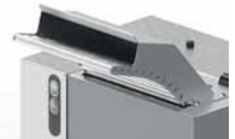
Scivolo con rulli Roller slide