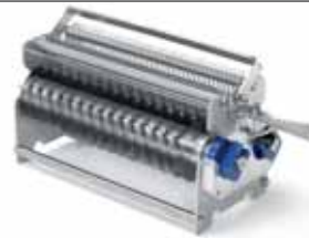
Gruppo lame taglio strisce 8 - 10 - 15 - 20 mm Meat strip cutter 8 - 10 - 15 - 20 mm