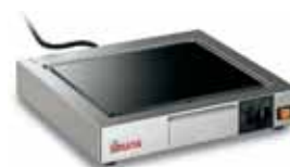
TOP CORT VT