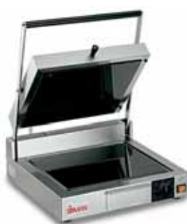
CORT VT LL