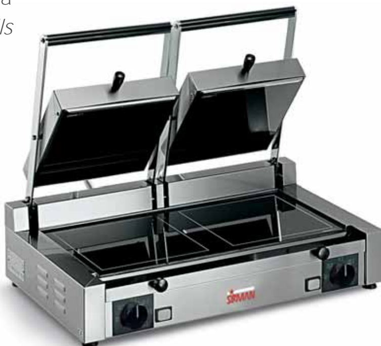
PD VT LL-LL