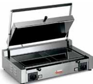
PD VU LL-LL