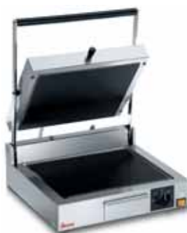
CORT VT RR