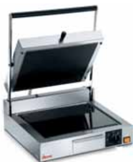
CORT VT LR