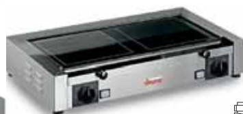
TOP PD VT